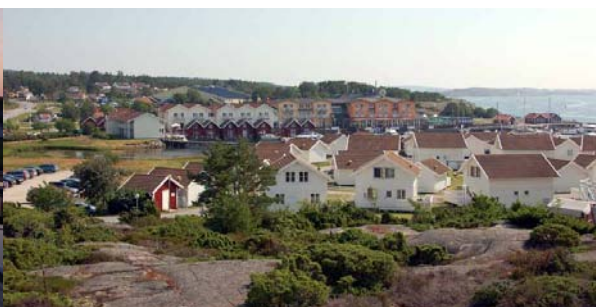
Delar av norra stugbyn i förgrunden och hotellet i bakgrunden.