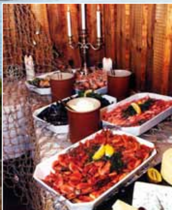
Västkustens Special Skaldjursbuffé