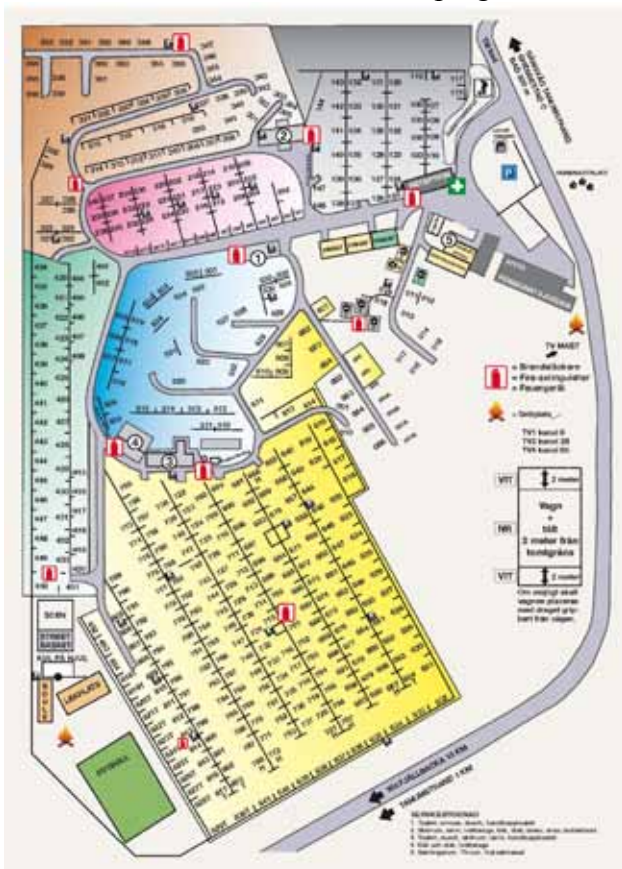
Översikt Grebbestads Camping